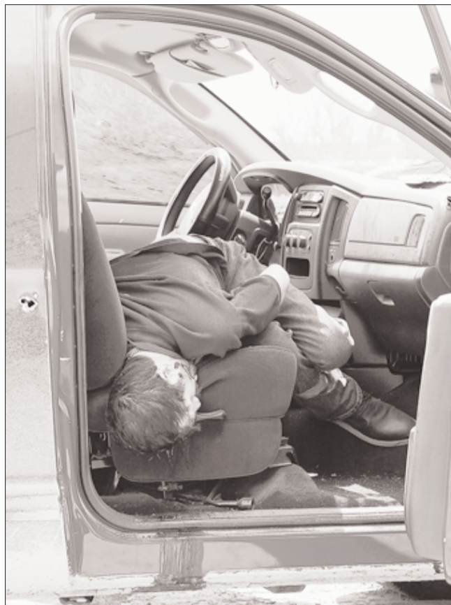
MONTERREY, N.L.- Un solo hombre de los 6 ejecutados estaba en la cabina, el resto en la caja de la camioneta.

El personal de Servicios Periciales de la Procuraduría de Justicia de Nuevo León, que busca establecer la identidad de las víctimas, recogió en un radio de 50 metros del vehículo al menos 50 casquillos percutidos calibre .223 milímetros para rifles de asalto AR-15, así como diez de .45 automático y otros tantos 7,62 de 39 para rifle AK-47, conocido como cuerno de chivo.