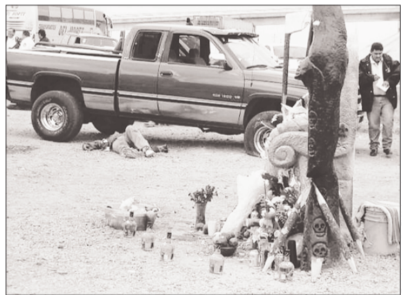
NUEVO LAREDO, TAMPS.- Un hombre devoto de la imagen de la santa muerte fue ejecutado ayer cuando salía del altar edificado a la altura del kilómetro 22 de la carretera que comunica a esta frontera con Monterrey.

Por el contrario, dijo, el temor y la incertidumbre de los ciudadanos de ser víctimas de un atentado provocó que en los últimos meses los católicos dejen de acudir a las iglesias, aunque señaló que cuando ocurre algún acto de violencia o un secuestro de inmediato las familias van a las iglesias a orar y a pedir por la recuperación del familiar.