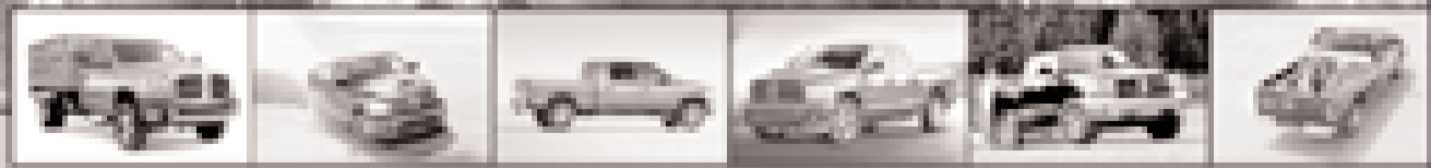
Ram 4000 Ram SRT-10 Ram Mega Cab Ram SLT 3500 Dakota Ram ST 3500

El cambio, sólo la nueva Dodge Ram 3500 SLT Quad Cab 2006 tiene un motor HEMI de 5.7L, seguros y cristales de puentes eléctricos, control de velocidad, acceso remoto sin llave, el asiento trasero tipo banca abatible 60/40, sistema de comunicación manos libres Uconnect, AM/FM/CD con control de caja de CDs, 4 bocinas y aire acondicionado. Por eso si ves algo más potente que esto, estamos seguros de que es otra Ram.