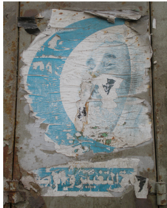
Propaganda electoral de “Cambio y Reforma”. Enero de 2011, Ramallah.