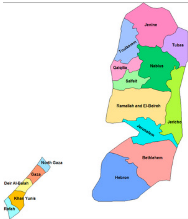
Mapa 1. “Ubicación geográfica de los 16 distritos electorales”.