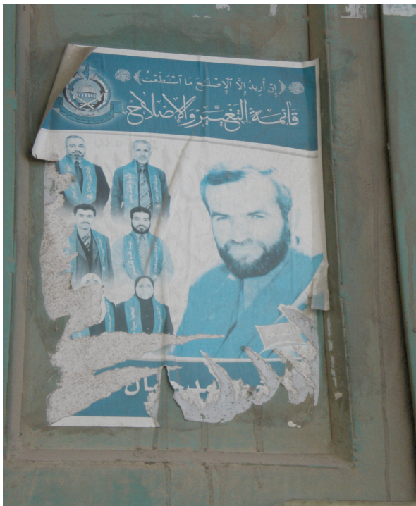
Propaganda electoral de “Cambio y Reforma”. Diciembre de 2010, Hebrón.

Durante la campaña electoral, Hamas también demostró que era capaz de hacer un buen uso de todo tipo de estrategias: desde vestir de verde a sus adeptos, llenar las calles con propaganda y los autos con pegatinas, hasta invertir en llamadas y mensajes de texto a los teléfonos móviles de los votantes, llevar a sus candidatos a los programas de radio y televisión (en enero de 2006 la televisora Al-Aqsa fue inaugurada y continúa siendo una de las principales promotoras del movimiento), etc.