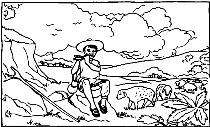
El lenguaje utilizado en esta edición no está vigente pero es útil como antecedente de las ediciones posteriores

Bí 2 níh 3 míh 1 hí 3 jmí 1 lín 3 jan 2 tsá 2 jlánh 1 re 2 nio 2 tsí 3 , hí 3 jmí 1 tǐ 2 zain 32 lín 32 sun 1 ; hí 3 jáun 2 , nī 1 nī 3 ngí 21 jáun 2 hí 3 nī 3 jan 1 já 1 ziáh 2 tǐ 2 choh 23 hmá 2 tá 2 , hí 3 jáun 2 tǐ 2 can 23 hí 3 tǐ 2 jmu 2 hmá 2 tá 2 le 2 , hí 3 tǐ 2 jiei 32 hí 3 juáh 3 hí 3 jmu 2 sun 1 . Jáun 2 né 3 , jmí 1