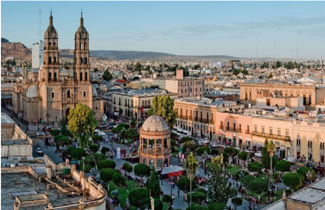
Gómez Palacio, Durango.

Sin embargo, el estudio indica que los habitantes de La Laguna "no entendían lo que estaba pasando, no tenían una idea clara de qué estaban enfrentando". Fue a partir de que un grupo de empresarios de la región comenzó a explorar a fondo el tema, que los diferentes sectores sociales comenzaron a jugar un papel cada vez más determinante para implementar una serie de medidas que permitieron reducir significativamente los niveles de violencia.