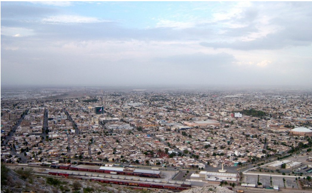
Torreón, Coahuila, México, 16 de octubre de 2012.

¿Pero qué fue lo que ocurrió en la Laguna para que pasara de ser una de las ciudades más violentas de México a una zona de tranquilidad, mientras el resto del país continúa con una alza en los índices de violencia?