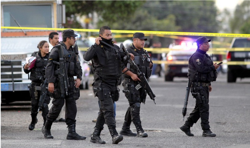
Policías en una escena del crimen en Guadalajara, Jalisco, México, 18 de enero de 2018.

El modelo incluye un Mando Único y mesas de seguridad a nivel estatal en donde todas las corporaciones definen una estrategia común. Otro punto importante es la homologación de la normatividad municipal para facilitar la captura de delincuentes.