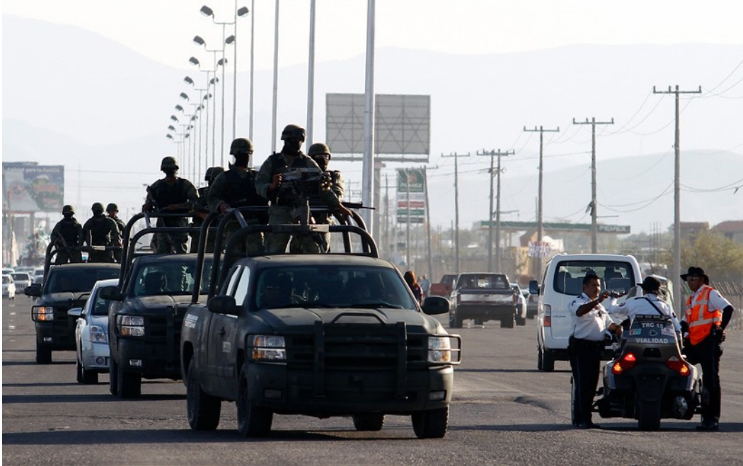
Uniformados patrullan Torreón, Coahuila, México, 10 de septiembre de 2011.

Además del papel que jugó la Fiscalía de Chicago a la hora de procesar y desmantelar a las bandas criminales, el académico asegura que la intervención de la sociedad organizada jugó un papel clave en el proceso de pacificación de la ciudad estadounidense.