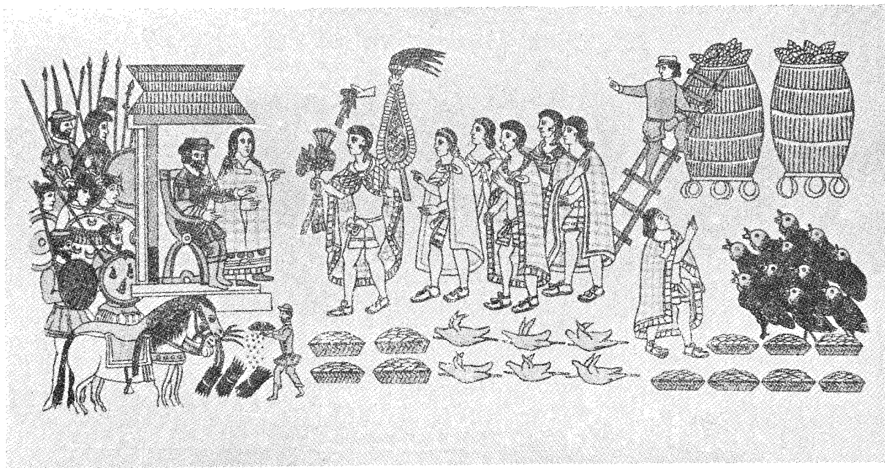
Fragmento del Lienzo de Tlaxcala: "Aquí salieron a encontrar a los señores españoles, y les dieron toda clase de alimentos".