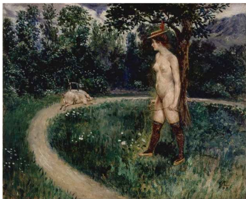
Julio Ruelas, La domadora , 1897, óleo sobre cartón, en El viajero lúgubre , pp. 38-39.

sátiros persiguiendo muchachas desnudas y asustadas; cuerpos de jóvenes y de mujeres yacentes o desmayadas por la violencia”. 67