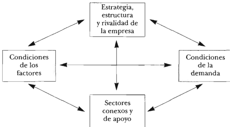
FIGURA 1 Determinantes de la ventaja nacional

te localizado. Las ventajas competitivas adoptan un modelo de diamante de cuatro aristas que incluye elementos microeconómicos, derivados de las estrategias competitivas de las empresas (véase Porter, 1993: 55-67), y macroeconómicos que se establecen por el comportamiento del comercio internacional. Las esquinas del diamante se definen por los siguientes determinantes competitivos: i ) condiciones de los factores, que tienen que ver con la oferta de mano de obra especializada o capital humano, infraestructura y creación y dotación de factores; ii ) condiciones de la demanda, en función de la composición de la demanda interna y del comportamiento de la demanda exterior; iii ) condiciones de los sectores conexos y de apoyo, en cuanto al acceso oportuno y eficaz a los principales insumos, unidades para coordinar o compartir actividades en la cadena productiva y conformación de cluster de actividades, y iv ) condiciones de estrategia, estructura y rivalidad de la empresa, referentes a cómo se crean, organizan y gestionan las compañías y la naturaleza de la rivalidad doméstica (Porter, 1991: 110-181) (véase la figura 1).