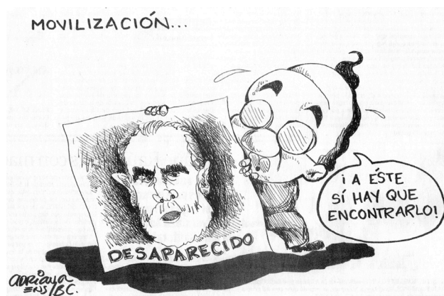
El Mexicano, 18 de mayo de 2010

desaparecidas andaban en malos pasos, pese a que sus familiares digan lo contrario 139 , dijo el Subprocurador de Zona en Mexicali, Javier Salas Espinoza para un diario local. Siete años después y en el contexto de una guerra declarada al crimen organizado, el Presidente de México, Felipe Calderón, declaró: “Más que una ‘guerra del gobierno contra el narcotráfico’, la guerra más mortífera que existe es la que libran los criminales entre sí... En la disputa por el control de una plaza se producen homicidios especialmente violentos, como decapitaciones, torturas o ejecuciones colectivas y se generan agravios que recrudecen aún más su nivel de violencia” 140 .