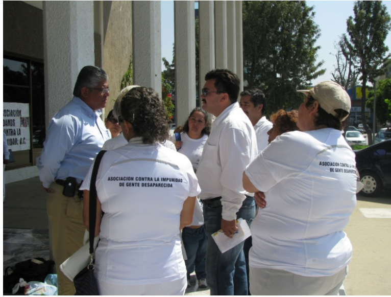
El acto performativo del Gobierno Estatal incluyó una visita al plantón que se daba por terminado. A la izquierda Levy. A la derecha familiares de las víctimas. Septiembre 24 de 2011.

El destierro del espacio público significó más que un giro en la relación con el Gobierno del Estado, la pérdida paulatina de un ancla que mantenía la dinámica de la lucha en la esfera pública y privada de la organización. La toma del espacio, el grito, la voz incómoda que antes se tomaba la plaza pública cada viernes durante un año; vinieron a encerrarse en el silencio de reuniones a puerta cerrada, donde sólo podían asistir los líderes de la ACCI y los funcionarios encargados de representar a quienes nunca habían dado la cara, los directos responsables de tomar decisiones. Así, poco a poco, la Asociación fue perdiendo presencia en los medios de comunicación y en el paisaje urbano.