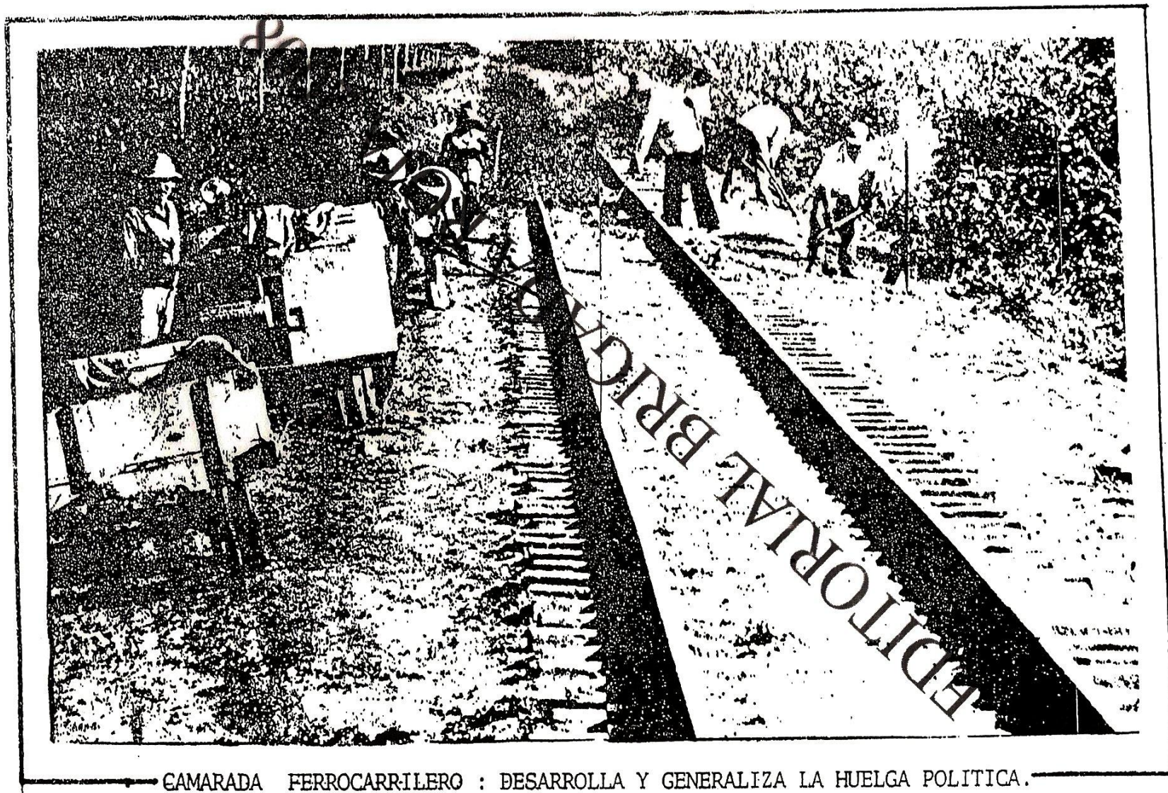
— CAMARADA FERROCARRILERO : DESARROLLA Y GENERALIZA LA HUELGA POLITICA. —