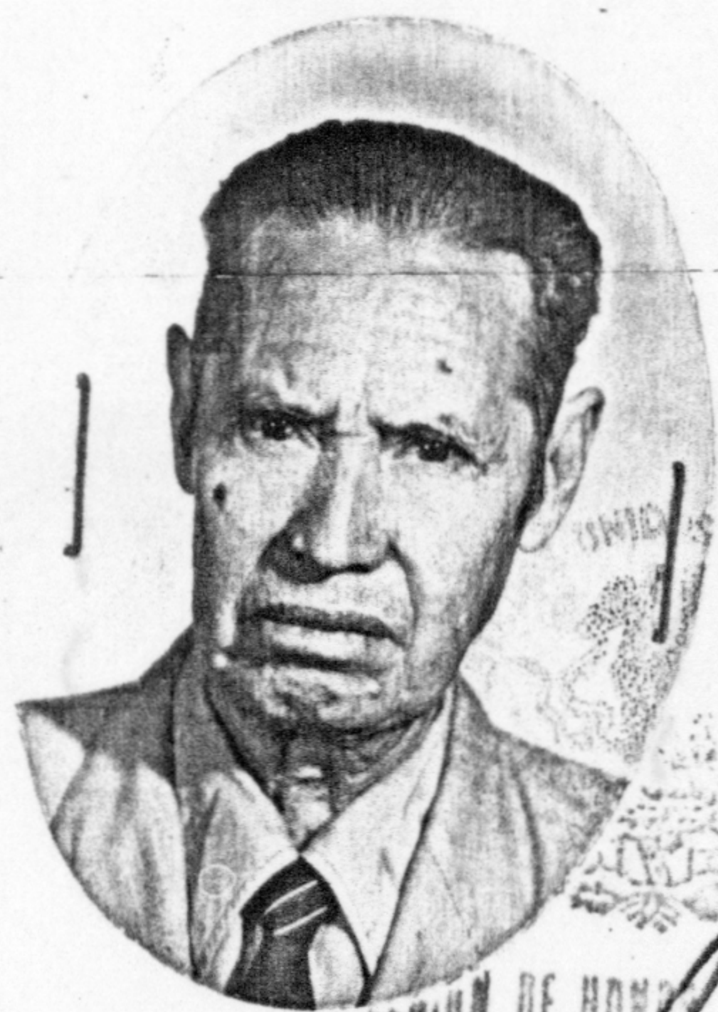
LEGION DE HONOR MEXICANA COMANDANTE GENERAL

Lomas de Totelo, D. F., a 30 de enero de 1973.