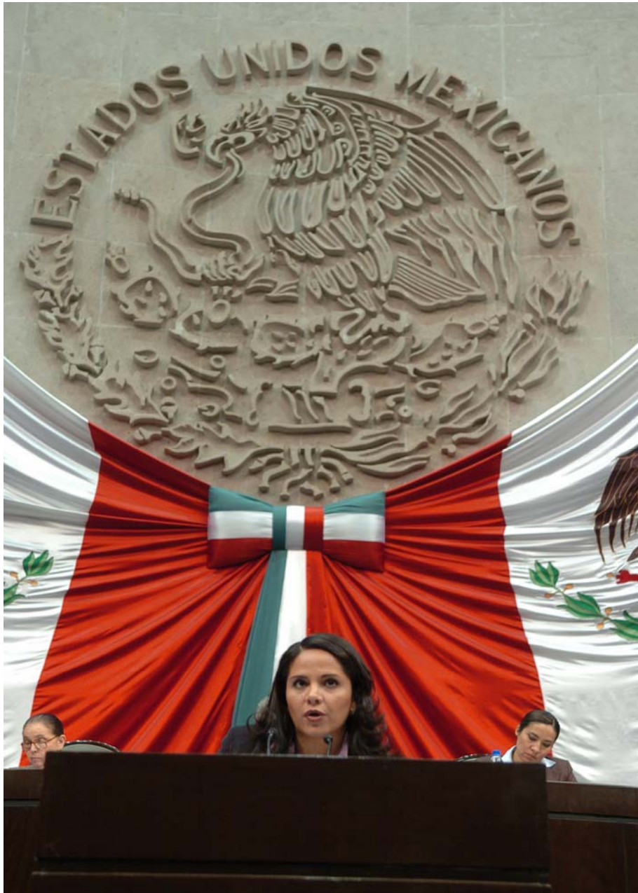
La Diputada Lilia Guadalupe Merodio en Tribuna.