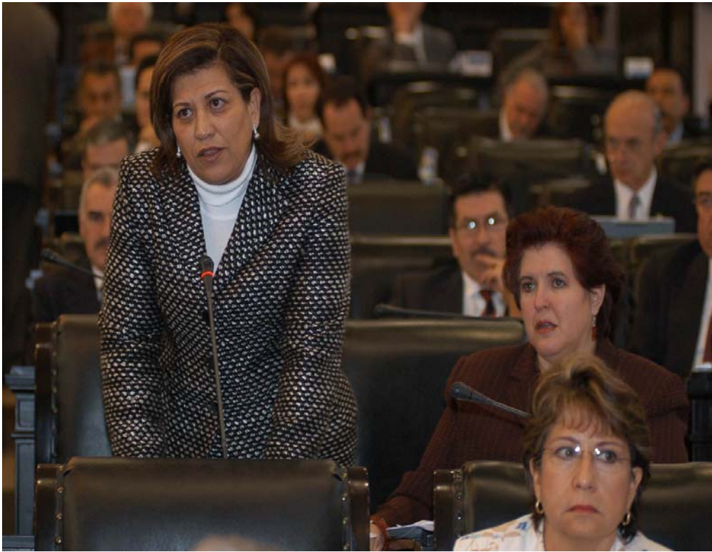
Diputada Blanca Judith Díaz Delgado en el Senado de la República.