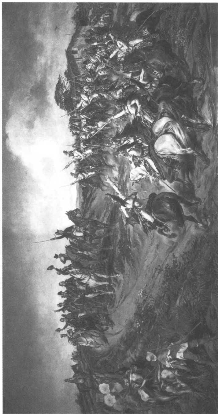
Independencia o muerte, de Pedro Américo, 1888.