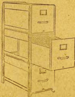
"Y and E" Drawer Style Steel Transfer Cases

An excellent transfer unit. Strong frame construction. Brass trim bolted on. Roller-bearing drawers. Capacity of each drawer, 5000 papers with folders. Letter-size only, No. 704.