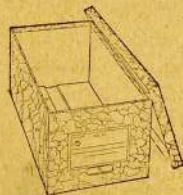
"Y and E" Style "A" Set-up Transfer Cases

One drawer units. Particularly strong, protective and easy to operate. May be stacked vertically or horizontally. Self-interlocking. Bill-size No. 5376; letter-size No. 5577; cap size No. 5578.