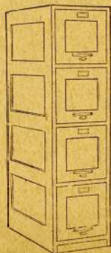
"Y and E" 4-drawer Wood Transfer Cases

Have easy rolling drawers and patented self-interlocking device. Are strongly built, with brass trim bolted on. Sizes shown are, from top to bottom, bill-size No. 76; letter-size No. 77; cap-size No. 78.