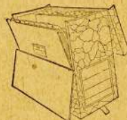
"Y and E" Style "E" Vertical Transfer Cases

Style "A" Knock-down Transfer Cases are similar to Set-up, but collapsible, to save storage space when not in use. Bill-size No. 73; letter size No. 74; cap-size No. 75.