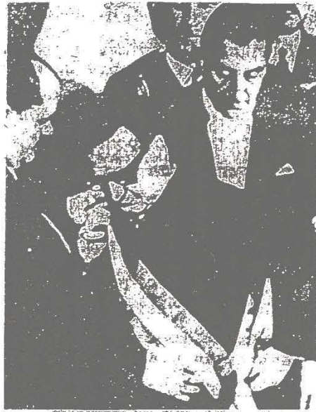
SE INICIA LA COMEDIA