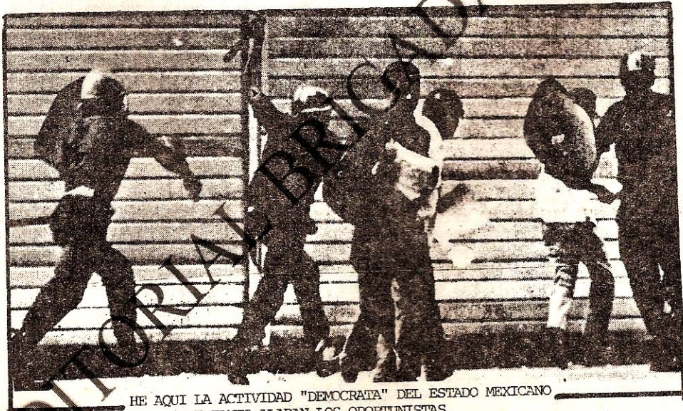
HE AQUI LA ACTIVIDAD "DEMOCRATA" DEL ESTADO MEXICANO QUE TANIO ALABAN LOS OPORTUNISTAS.