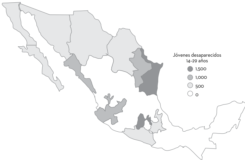
FIGURA 10.2 ESTADOS EN EL PAÍS CON MAYOR CANTIDAD DE JÓVENES DESAPARECIDOS