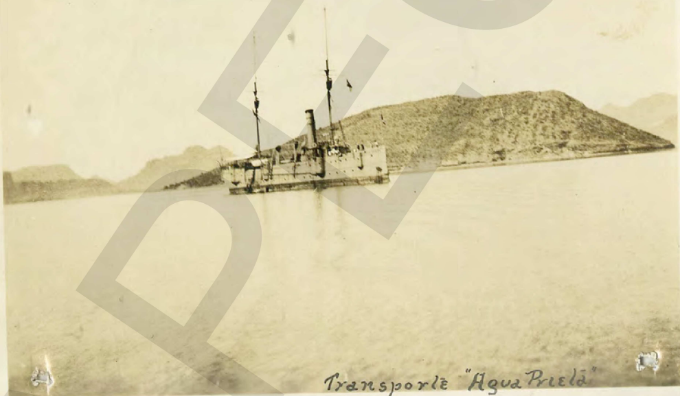
Transporte "Agua Prieta"