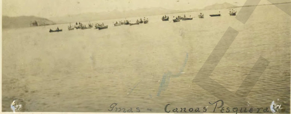
Ymas - Canoas Pesquera