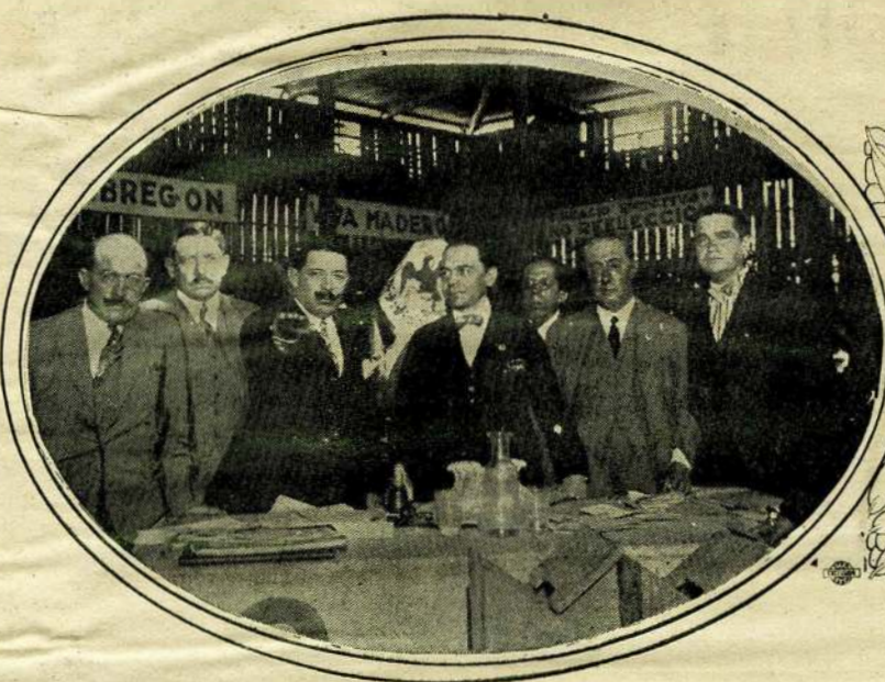
El señor general de división don Arnulfo R. Gómez, protestando ante los Delegados de la Convención Nacional Antirreeleccionista como Candidato a la Presidencia de la República, cumplir y hacer cumplir las leyes y llevar a la realidad los postulados de la Plataforma de Gobierno.