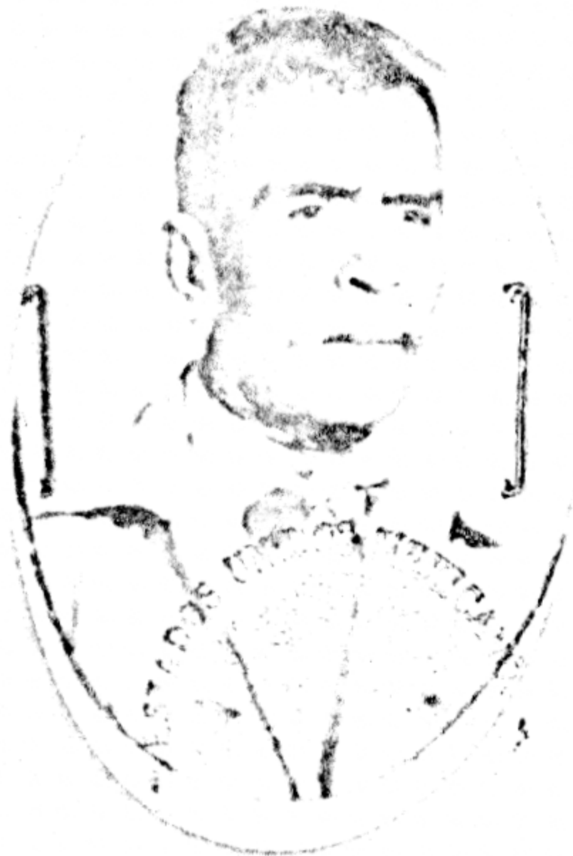
Residencia Municipal de Tlaltizapán Edo. de Morelos

A PEDIMENTO DEL PROPIO INTERESADO Y PARA LOS USOS QUE MEJOR LE CONVENGAN A SUS INTERESES, SE LE EXPIDE Y FIRMA EL PRESENTE CERTIFICADO DE RESIDENCIA EN TLALTIZAPAN MORELOS A LOS DIECINUEVE DIAS DEL MES DE AGOSTO DE MILNOVECIENTOS SETENTA Y CINCO.