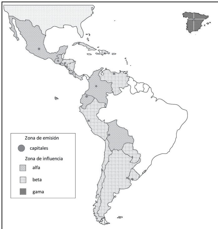
Zonas de emisión y de influencia (PCA).