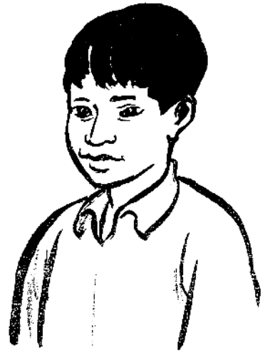
Li 3 po 1