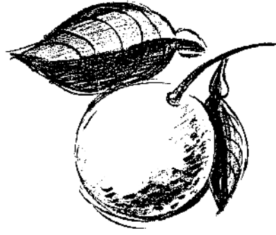
ra 3 xa 24 naranja