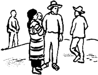
xu 4 ta 4 gente