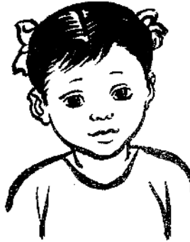
Sa 3 ve 24