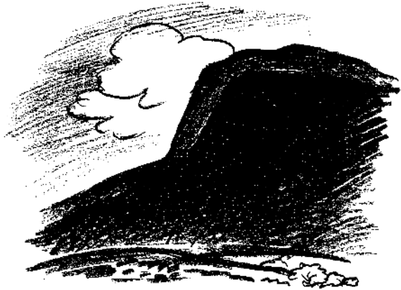
na 4 xi 4 cerro