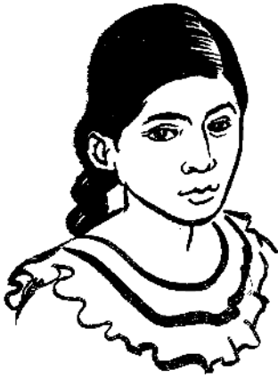
Che 2 lu 4