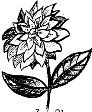
na 3 xu 21 flor