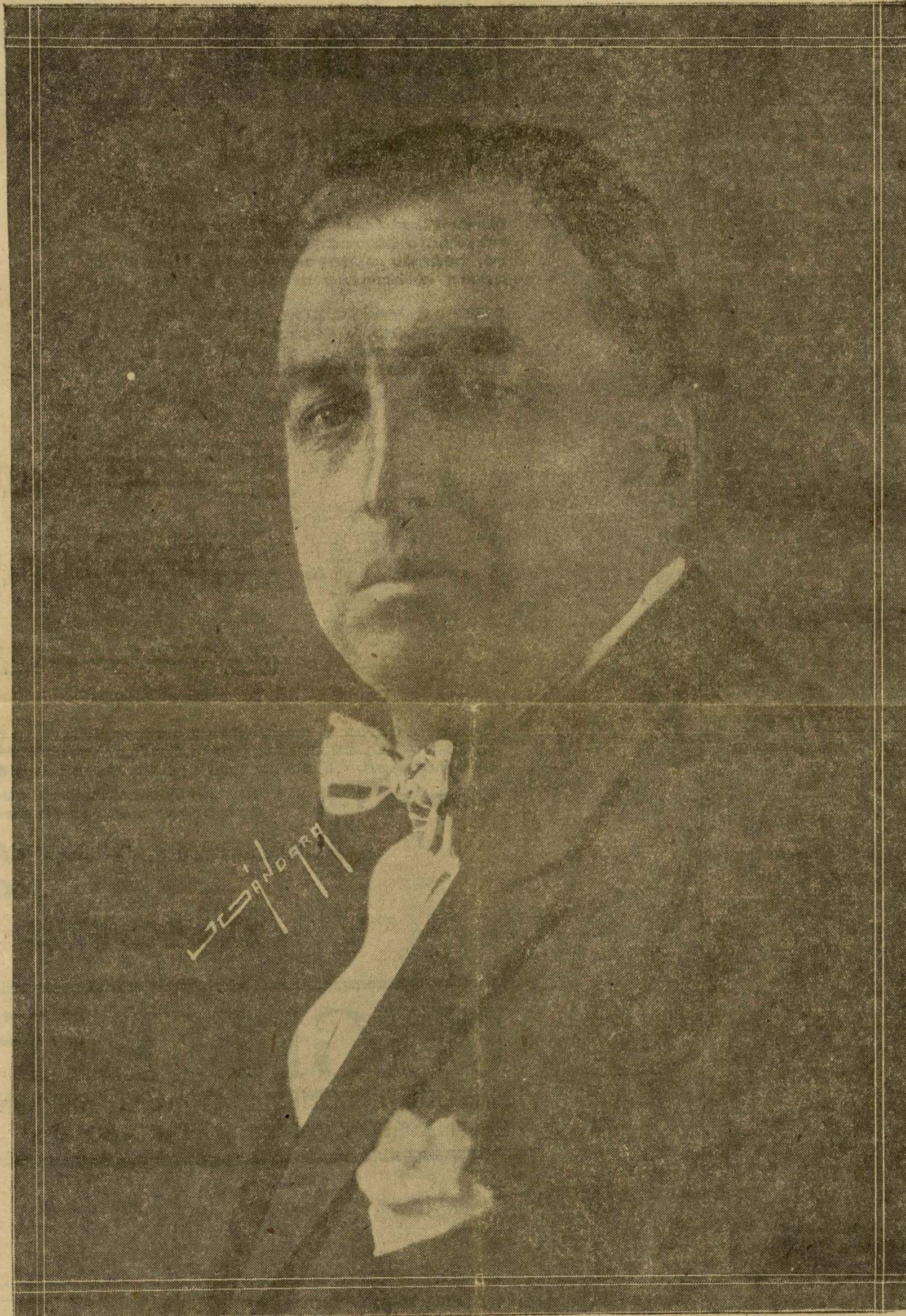
Sr. General CARLOS A. VIDA., Gobernador Constitucional del Estado de Chiapas

Como en el Estado, a excepción del Ferrocarril Pan-Améri-