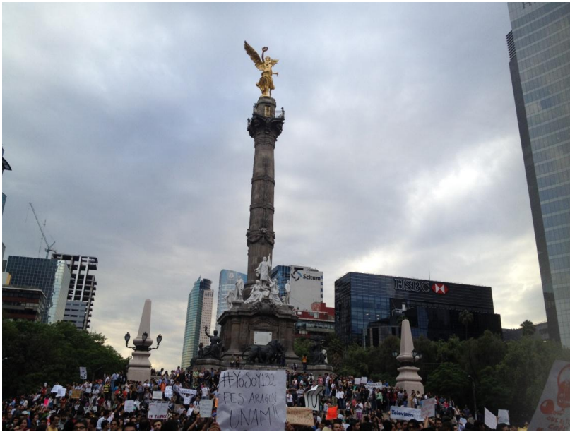
23 de mayo 2012