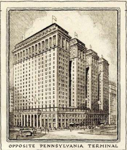
OPPOSITE PENNSYLVANIA TERMINAL