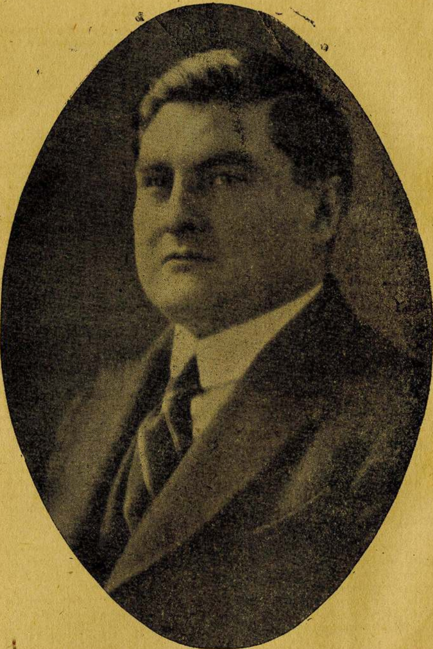
LIC. EMILIO PORTES GIL, Presidente del Segundo Congreso de Ayuntamientos.