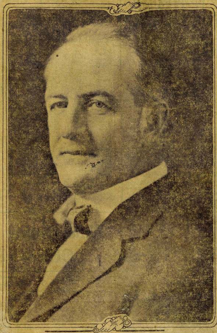
This is the latest photograph of Governor Thos. E. Campbell, renominated by the republicans of Arizona Tuesday without opposition. Governor Campbell's splendid record in office is expected to lead to victory at the polls in November.