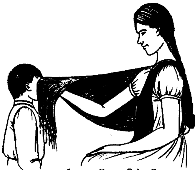
Lo que No se Debe Hacer

No debemos usar los peines de unos y otros, lo mismo que los rebozos y sombreros. En esta forma transmiten parásitos. Tampoco debemos hacer nuestras comidas sin lavarnos las manos.