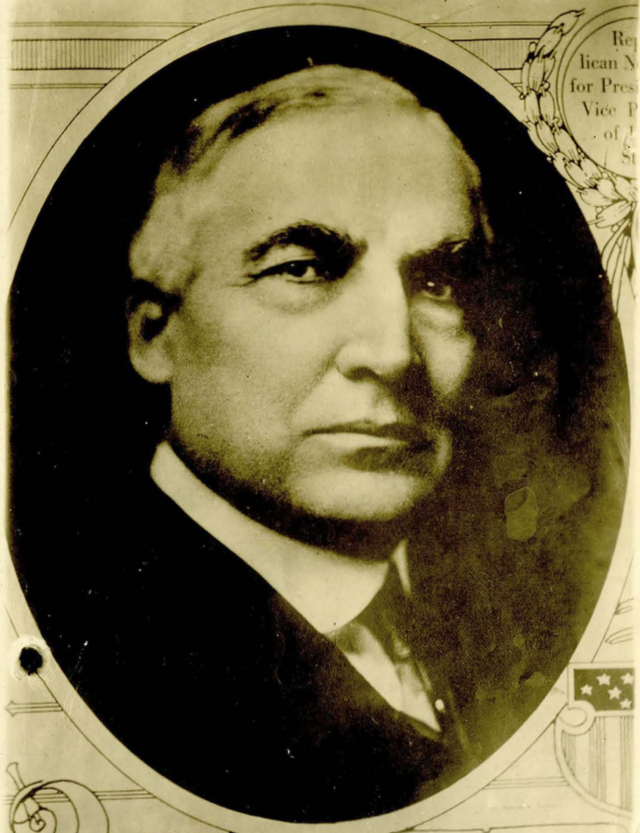
WARREN G. HARDING