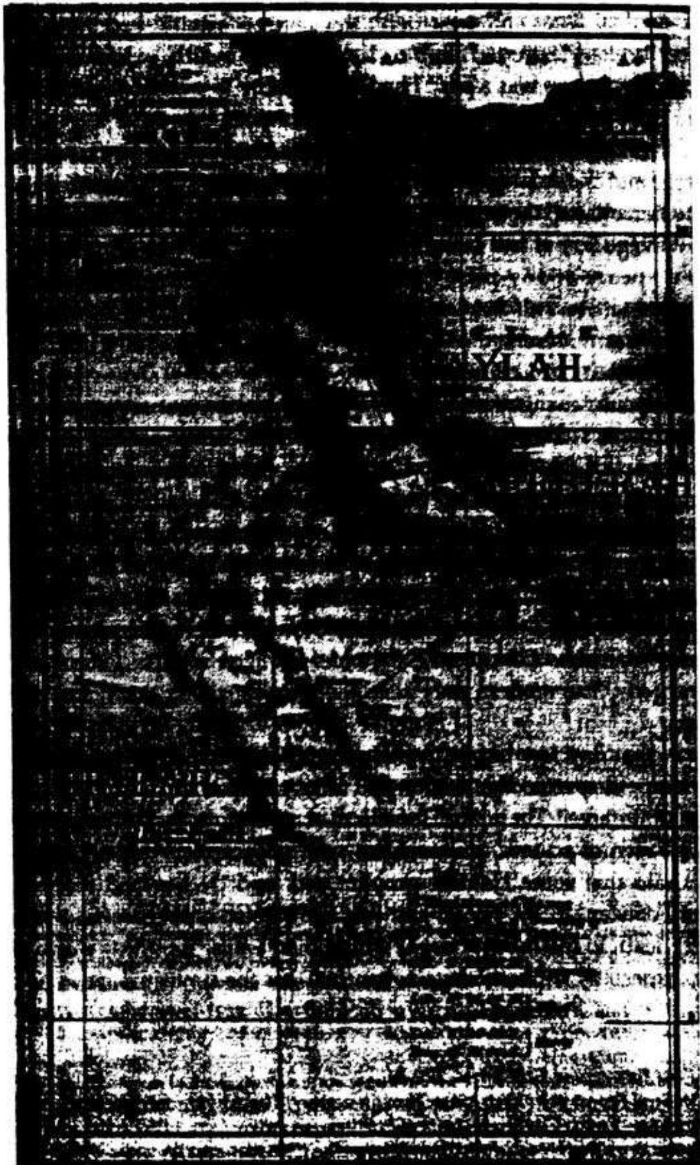
La ruta a Harar.