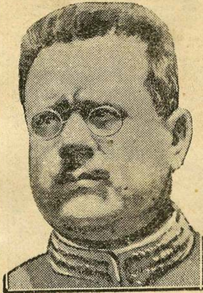
GENERAL BENJAMIN HILL

El editorial político del ingeniero Félix F. Palavicini, publicado en nuestra edición de ayer, ha causado la más viva impresión. En los círculos políticos especialmente provocó animados comentarios, sobre todo porque plantea la cuestión de la próxima campaña presidencial en los términos más claros y exactos: no es probable el surgimiento de una candidatura civil, y aunque lo fuese, más aún, aunque triunfase, sería difícil que actuara con éxito y con el apoyo del Ejército el elegido. De ese modo, la lucha se llevará a cabo sólo entre los candidatos militares.