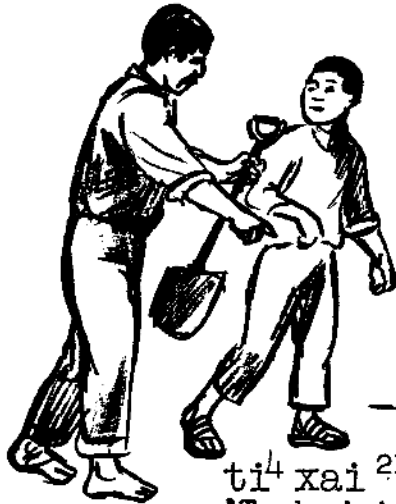
ti 4 xai 21 ¡Trabaja!