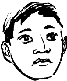
nka 4 kjai n 21 Cara.