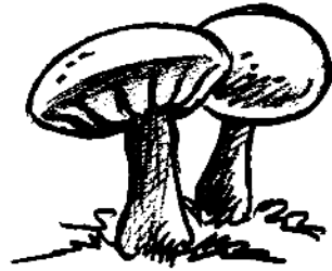
tjai n3 Hongo.