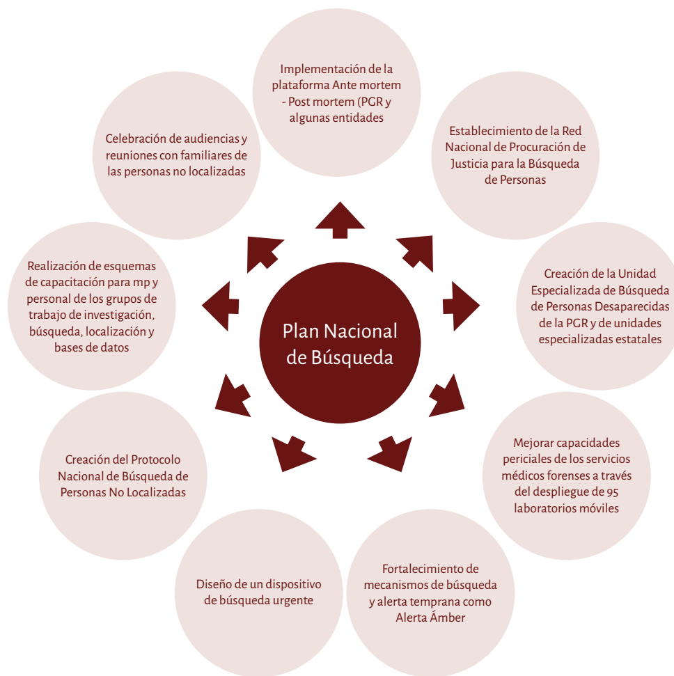
Esquema 3. Plan Nacional de Búsqueda