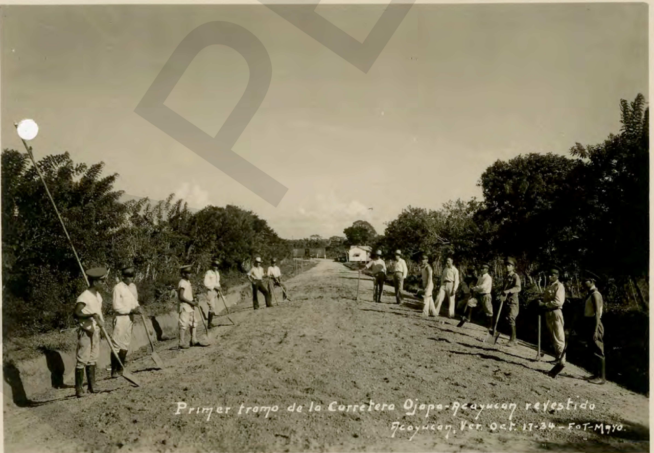
Primer tramo de la Carretera Ojapa-Quezaltenango retestado Quezaltenango, Ver. Oct. 17-34 — Fot-M970.