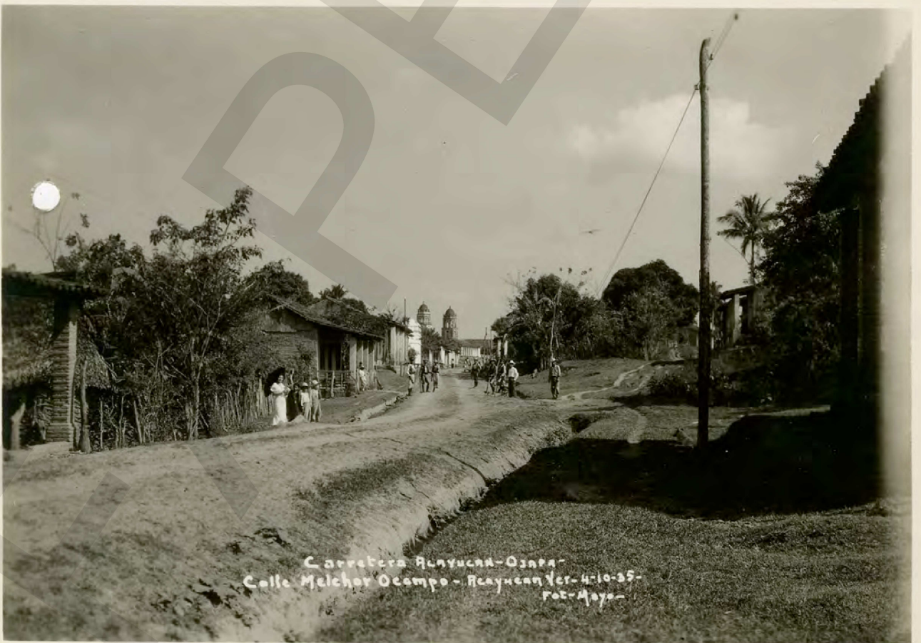
Сарретепа Ауаууса-Оуара Calle Melchor Ocampo - Ауауусау Вер-4-10-35- Fot-Mayo-