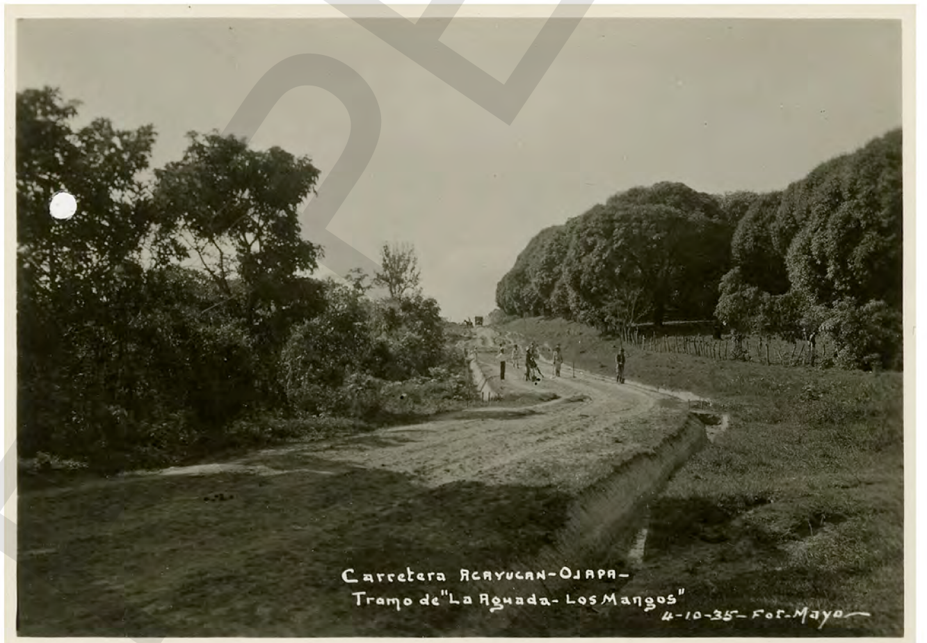
Carretera Acayucan-Ojapa- Tramo de "La Aguada- Los Mangos" 4-10-35- Fot. Mayo