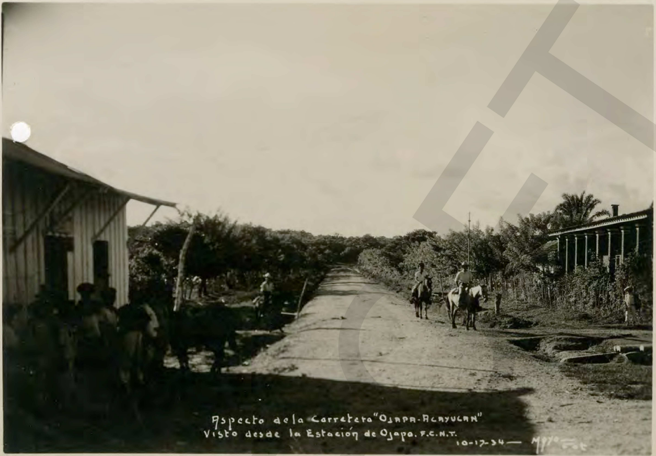
Aspecto de la Carretera "Ojapa-Quezaltenango" Visto desde la Estación de Ojapa, F.C.M.T.