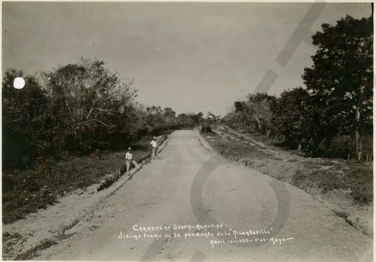
САРРЕТЕРА ОУАРА-АУАУСА Ultimo tramo de la pendiente de la "Picantavilla" Abril 10-1935 - Fot-Mayo-