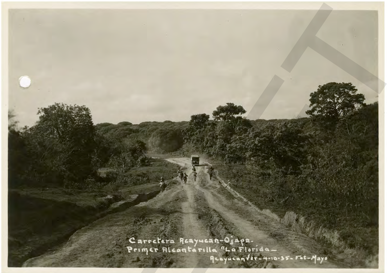
Carretera Acayucan-Ojapa- Primer Alcantarilla "La Florida- Acayucan Ver. 4-10-35- Fot. Mayo