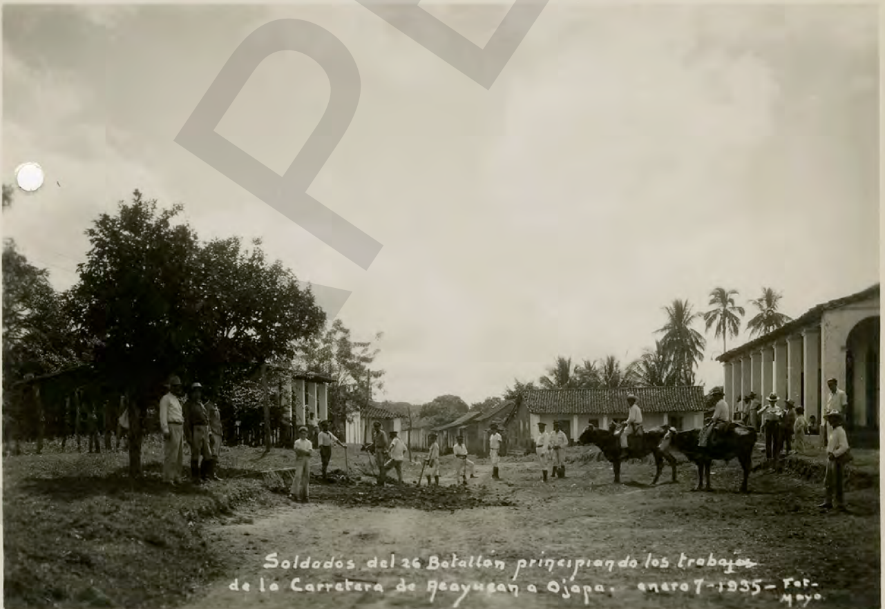
Soldados del 26 Batallón principiando los trabajos de la Carretera de Acayucan a Ojapa. enero 7-1935 - Feb- Mayo