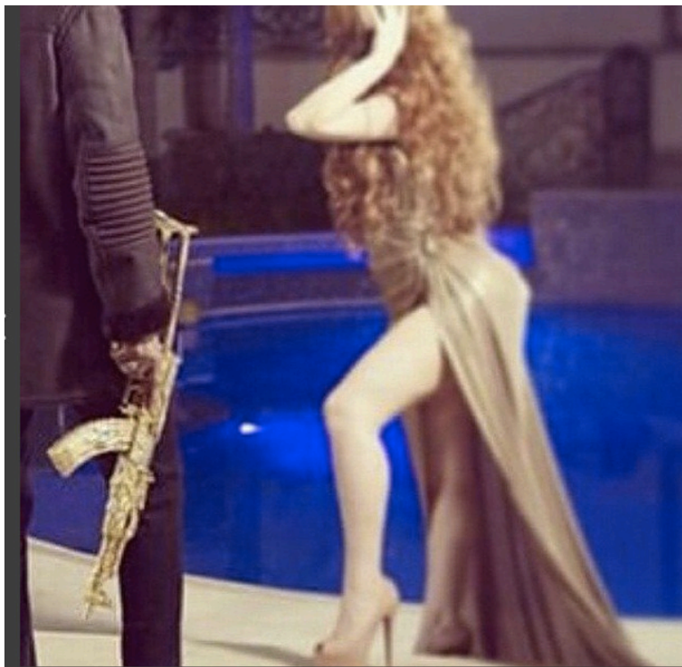
Fotografía 6 “La buchona”

Este tipo de letras enfatiza que el hombre consigue las mujeres dependiendo del dinero y poder que tengan, entre más poder y dinero, más mujeres puede obtener. Esta idea también es reproducida en las imágenes de las redes sociales.