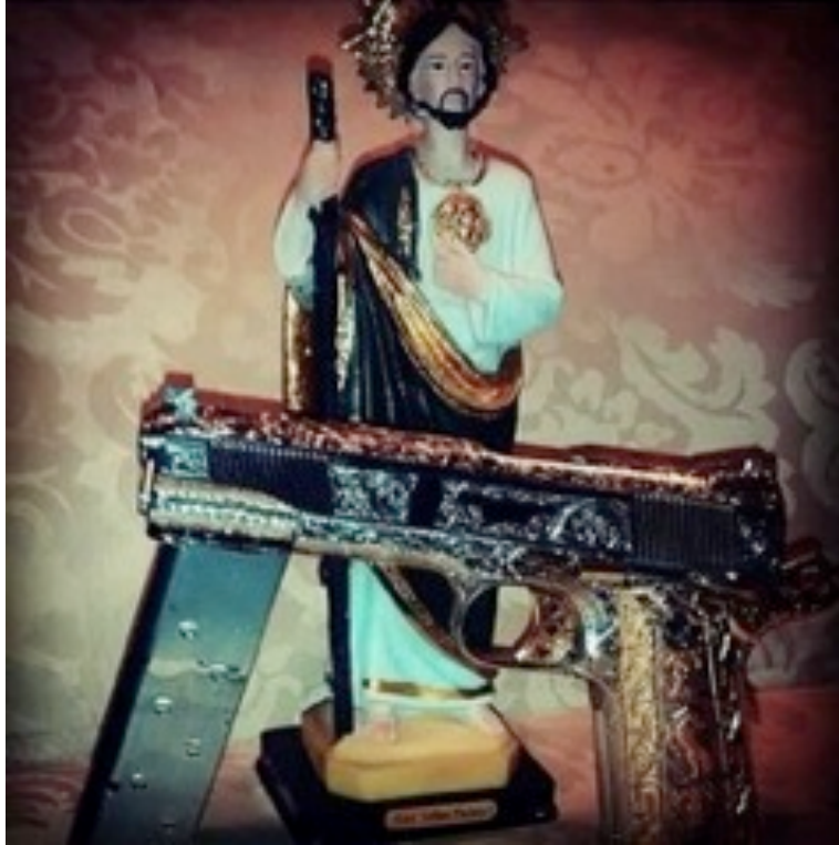
Fotografía 7 “San Judas”

“causas difíciles”. Entre los jóvenes alterados podremos encontrar la figura de este santo en ropa y joyas .