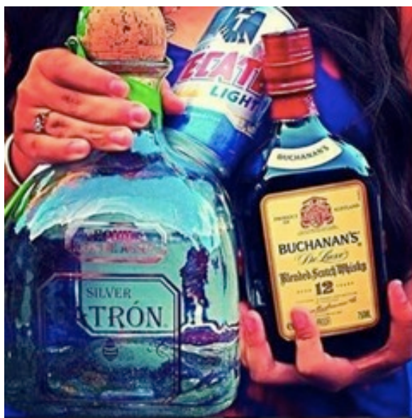
Fotografía 1 “Mujer con Buchanan’s”

En la imagen inferior obtenida de la etnografía virtual de la cuenta anteriormente mencionada, podemos ver cómo se exalta este tipo de marcas. La imagen de la mujer sosteniendo estas bebidas también es recurrente, incluso en los promocionales en los lugares se observan las imágenes de las bebidas y de mujeres vestidas con ropas entalladas, de cabellera larga, de senos y glúteos grandes. En otras palabras estos elementos serán ganchos de atracción para la población juvenil masculina que se identifica con o pertenece al MA, pues les dan oportunidad de performear su papel masculino. En primer lugar al exponerse ante las mujeres y generar un ideal de ellas como objeto de compañía y exhibición y la ostentación de su perfil económico al consumir los productos que son estereotipos de los narcos.