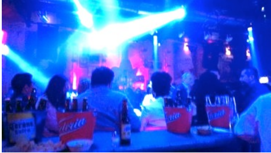
Fotografía 2 “El Atorón Grupero ”

de quebradita, que estaban practicando en la pista, que lucía vacía. En la imagen que se presenta a continuación, se puede observar el consumo de alcohol que hace la gente, gracias a las promociones que ofrece el lugar.