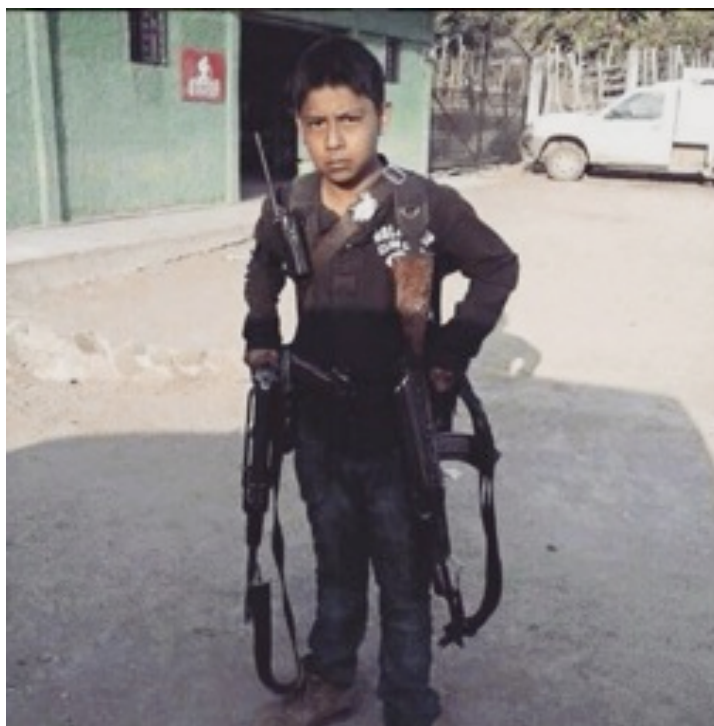
Fotografía 3. “Niño Sicario”

Para el análisis elegí canciones y vídeos que hicieran referencia a la pobreza en el ámbito rural y el urbano. Las canciones elegidas para el análisis fueron “Soy de rancho”, interpretada por El Komader y mi “Padrino el diablo” de la banda Trakalosa de Monterrey. Las letras de estas canciones nos narran cómo son los cambios en la vida del protagonista antes y después de su inserción al mundo del tráfico de drogas. En la imagen nos encontramos con la figura de un niño sicario que busca generar respeto y temor por estar fuertemente armado. También es importante el contexto que lo rodea, que nos remite a un pueblo rural de México, sugiriendo que es ahí donde desde muy pequeños los niños varones son captados por grupos delictivos.