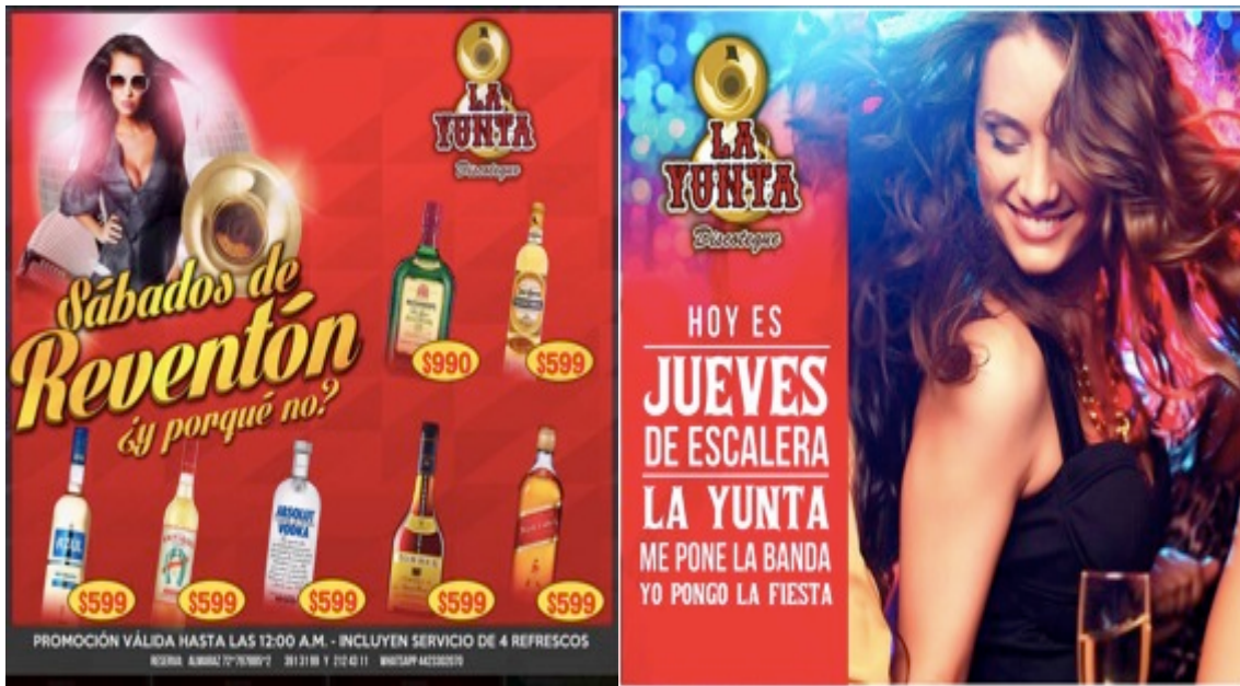
Imágenes 1 y 2 “ Promocionales del antro La Yunta”

“¡Fierro pa’la Yunta compa!” es lo que anuncian en el Facebook de este antro grupero de la ciudad de Querétaro. Este sitio es uno de los que más publicidad genera y tiene las promociones más atractivas para su clientela. En las siguientes imágenes podemos ver cómo se hace uso de las marcas de alcohol y de las corporalidades femeninas como parte del atractivo del lugar. Este antro es de los más referidos por los informantes como los lugares a los que van quienes quieren convivir con gente a la que le gusta y se identifica con el MA.