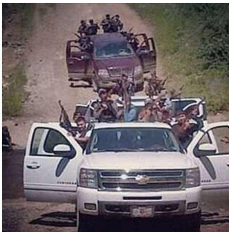
Fotografía 5 “Caravana Armada”