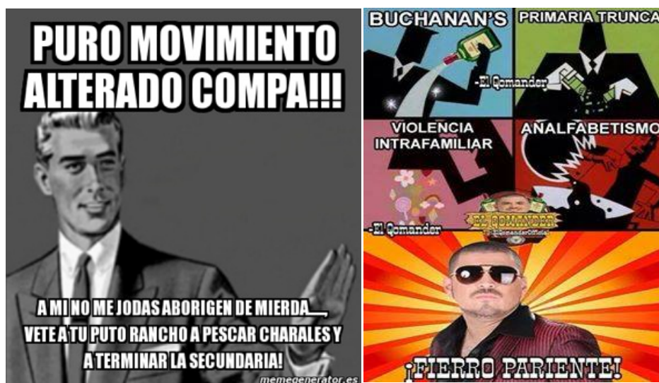
Imágenes 4 y 5 “memes sobre el movimiento alterado” Facebook. Fuente: Facebook.

De las características generales de los entrevistados es importante resaltar su nivel educativo, pues el estereotipo popular de las personas que se identifican o pertenecen al MA, sostiene que tienen una escolaridad baja, de acuerdo con las conversaciones que se generan en las redes sociales, donde el estigma se ve reflejado en las producciones culturales juveniles conocidas como memes . Estas imágenes que circulan en Facebook desacreditan a los jóvenes por ser seguidores del MA, atribuyéndoles falta de estudios, ser pobres y provenir de contextos violentos. En las siguientes imágenes podemos ver memes donde se describen las características de las personas insertas en el MA.