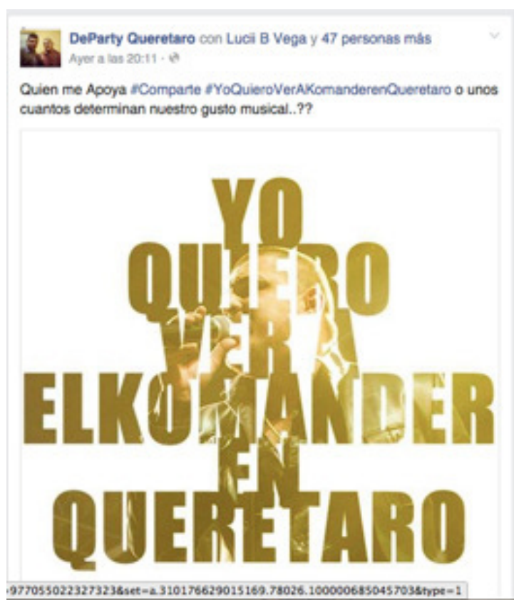
Imagen 3 “Apoyo concierto Komander”.

Surgió entonces una incertidumbre con respecto a lo que iba a suceder con el concierto. Los seguidores empezaron a postear en sus muros de las redes sociales una imagen del “Komander” junto con el hashtag #YoKieroVerAKomanderenQueretaro. Además los fanáticos empezaron a tener reacciones en contra del gobierno por medio de las redes sociales, expresándolas a través de comentarios en sus perfiles de Facebook o en la página del evento.