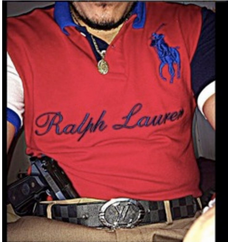
Fotografía 4 “Marcas y pistola”

Otro punto a resaltar con respecto al ejercicio de poder que tiene un viejón, es que puede mandar hacer sus canciones. Los intérpretes de los narcocorridos dejan en claro que lo que cantan es un encargo de estas personas que tienen jerarquía y poder dentro del cártel. En las canciones se enfatizan características como objetos valiosos que obtienen con el transcurso del tiempo y se resalta la destreza que tienen en sus labores ya sea matando o dirigiendo operaciones.