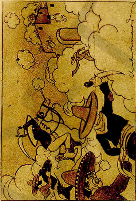
Mientras en la tierra se arma cada quinc