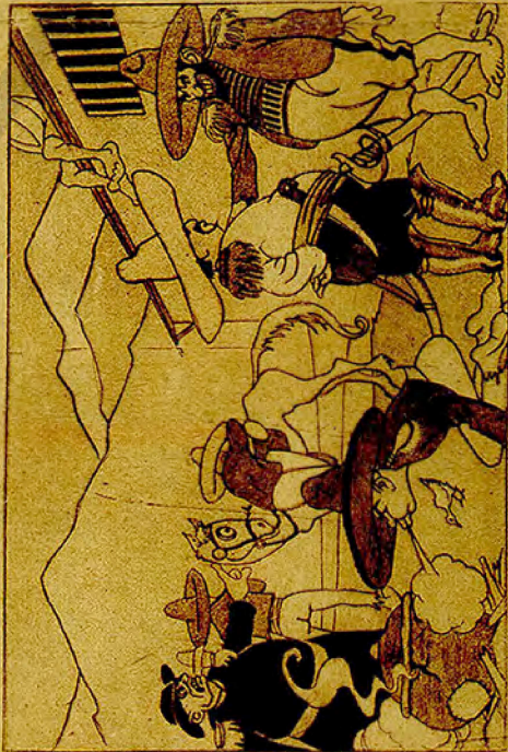
En Méjico son todos genera les, y hay que ver la calidad...