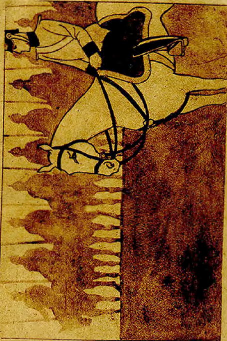
conocemos un Ejército correcto, observador de la Ley