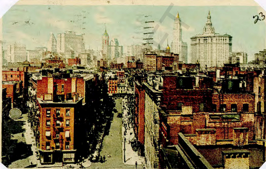
NEW YORK SKYLINE FROM MANHATTAN BRIDGE, NEW YORK