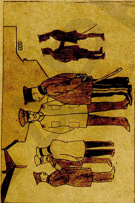
Mientras en Chile hay media docena de generales