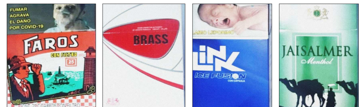
Imagen 1. Tipos de cigarrillos, vista de frente de las cajetillas