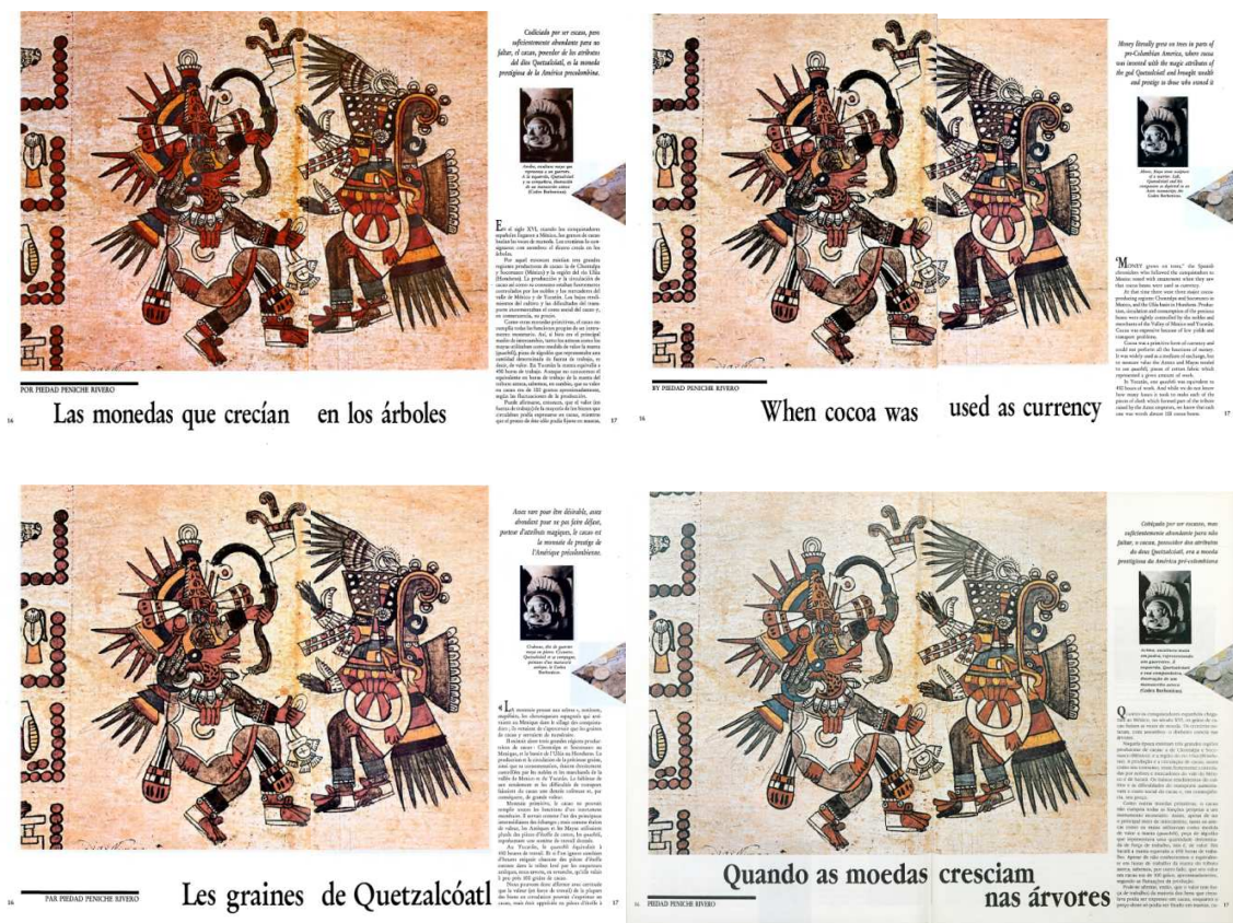
“Las monedas que crecían en los árboles”, publicado en enero de 1990, de Piedad Peniche Rivero, en español y en sus respectivas versiones en inglés, portugués y francés (sentido horario).

para la revista [...] se trata de enganchar la atención flotante de alguien que hojea un periódico; en consecuencia se proponen por lo menos dos niveles de texto: por un lado un fragmento corto y en grandes caracteres que condense la información y llame la atención, por el otro, para el lector que acepte ir más lejos, un texto en caracteres más pequeños donde se desarrollen argumentos. 12