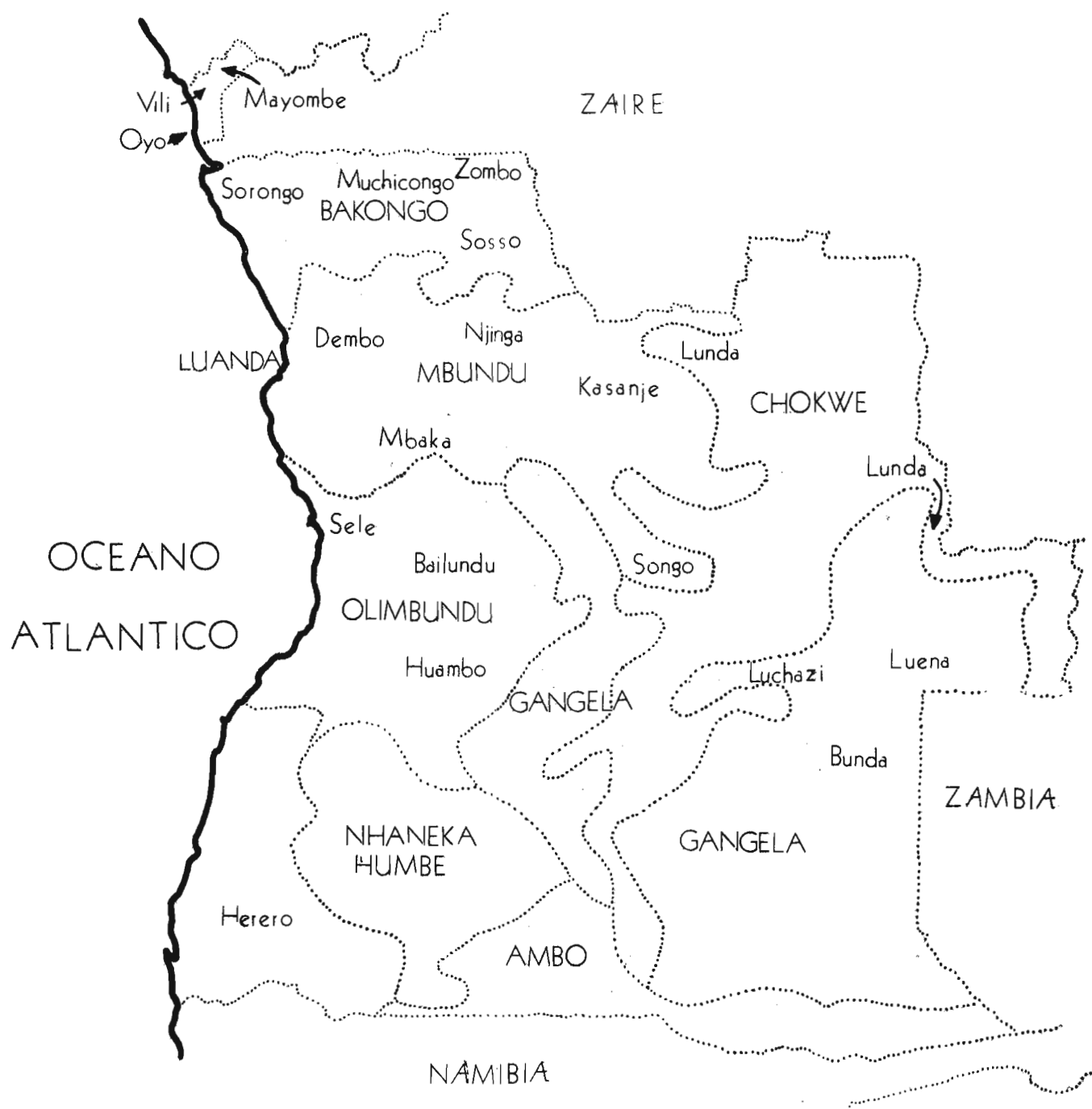
Mapa etnolinguístico de Angola