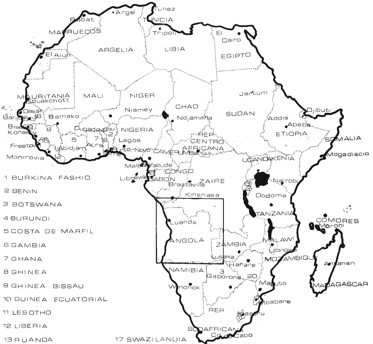
LOCALIZACION DE ANGOLA EN AFRICA