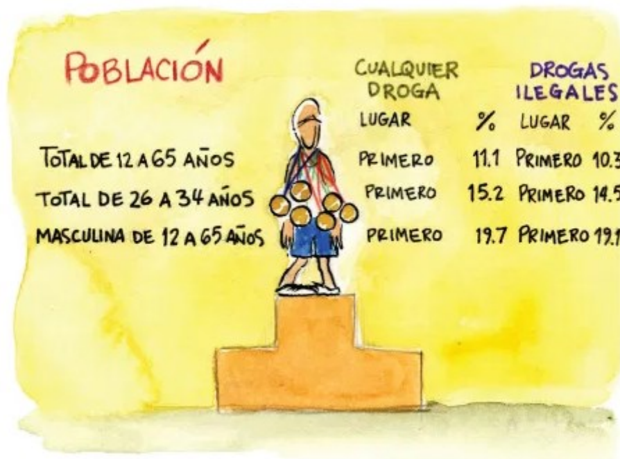
CUADRO 1. CONSUMO DE DROGAS ILEGALES EN TAMAULIPAS POR RANGO DE EDAD