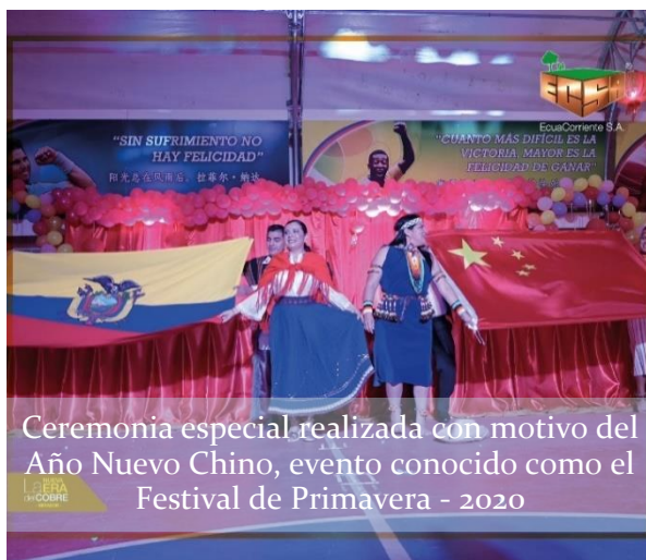
Gráfico No. 05 Celebraciones del año nuevo chino

El encuentro cultural como estrategia para construir un “nosotros”