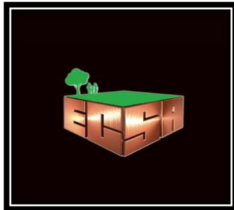
Gráfico No. 1. Imagotipo empresa Ecuacorriente - ECSA