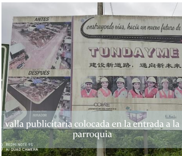
Gráfico No. 3 Configuración del espacio público parroquial, los símbolos omnipresentes