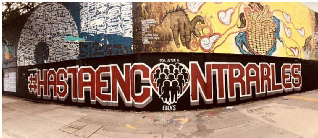
Así lucía el memorial antes de ser destruido en la madrugada del 20 de noviembre de 2021.

Por tanto, su exigencia a las autoridades municipales y estatales es que no haya impunidad en contra de quienes dañaron este espacio de memoria.