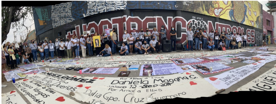
Integrantes del colectivo Por Amor A Ellxs posando el día de la inauguración del mural-memorial.