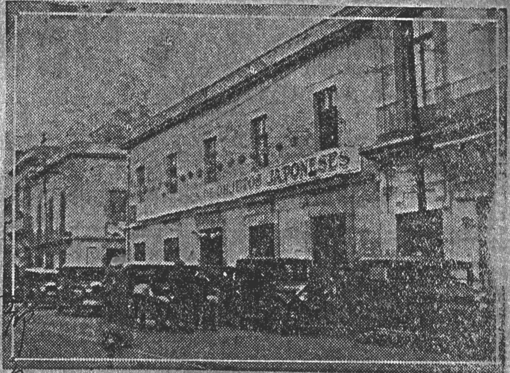
Fachada de la Compañía Internacional de Drogas, engalanada con motivo de la Gran Exposición Japonesa. Nótese la gran cantidad de automóviles de la concurrencia que asistió al Té Japonés.

y servilletas, los juegos de té de todos estilos, a cual más atrayentes; todo este conjunto de mercadería japonesa en un cuadro de flores naturales que adornaban los pasillos y la exposición, ese hermoso conjunto de arte oriental dejó encantada a la distinguida concurrencia.