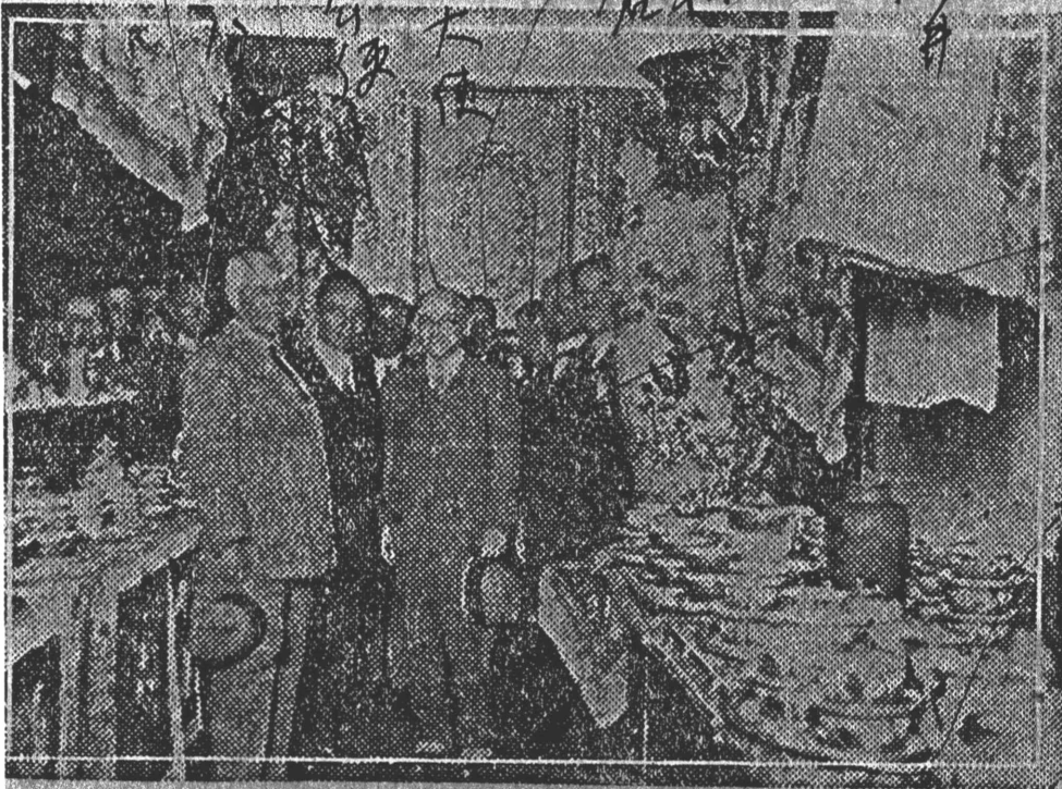
Los Excmos Sres. Embajadores y Ministros acompañados de los Directores de la Compañía Internacional de Drogas, S. A.

normal de un hombre; éstos se confeccionan con alma de cobre y las flores, pájaros, etc., que adornan esa obra de arte son construídos con alma de alambres de platino y oro; no menos llamaron la atención a los visitantes la gran variedad de kimonos, la elegancia de todos los festones bordados, la calidad de la seda, con la cual se confeccionan; dejaban satisfechos a los más exigentes, los objetos de laca en cuyo arte se ha especializado el