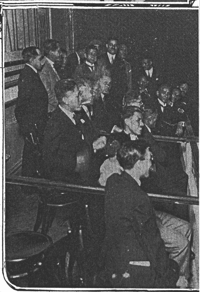
2.—Un aspecto del banquete ofrecido por los señores Director Compañía Internacional de Drogas, S. A., en "El Perroquet" del Frontón "México", a sus compatriotas e íntimas amistades, al momento de su regreso al Japón, llevándose de México las mejores impresiones.

nuestro Gerente, le manifestó que el deporte vasco le parecía sumamente interesante y que estaba considerando seriamente el implantarlo en el Japón. Por último, los directores de la compañía invitaron a a presenciar unos momentos en el cabaret de "donde volvieron a oír licores, terminando la reunión a la una de