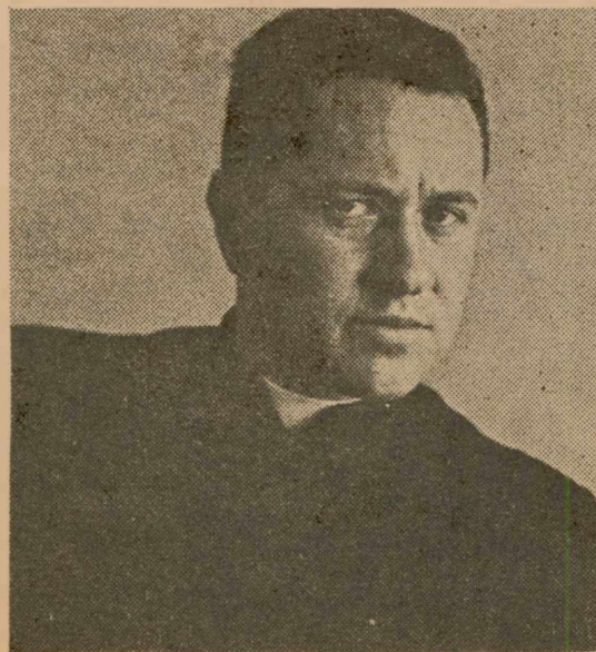
El Papa Juan XXIII (izquierda): "Abrió las ventanas de la Iglesia". El Padre Camilo Torres (derecha): "Sucumbió a la impaciencia por ver un continente más fraternal y justo".