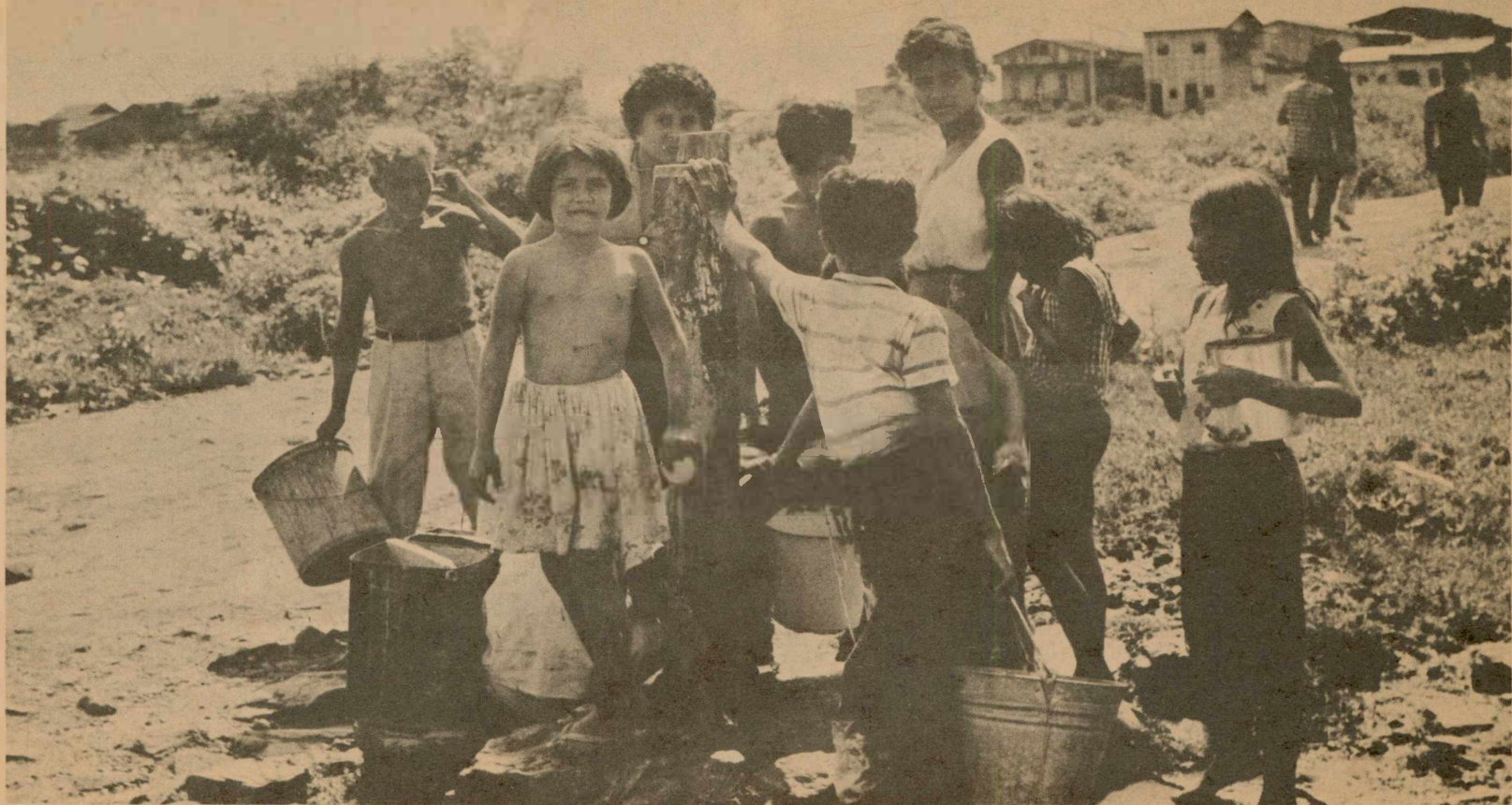
Un "estado" de violencia injusto e inhumano.

A propósito del viaje realizado por Pablo VI en octubre de 1965, a fin de hablar en la sede de las Naciones Unidas, se cuenta la siguiente anécdota: El superjet que conducía al Pontífice cruzaba veloz el océano, rumbo a Nueva York. Una azafata portando una pequeña bandeja de licores se aproximó al ilustre viajero y le preguntó delicadamente: "Santidad, ¿desea tomar un whisky?". Pablo VI, inquirió a su vez: "¿A qué altura volamos?". "Aproximadamente a 50.000 pies"... "No, gracias", musitó el Papa, añadiendo, mientras sonreído señalaba el cielo: "El Jefe está muy cerca".