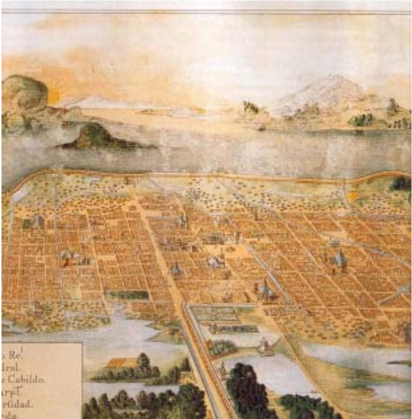
Vista de la ciudad de México (plano de Juan Gómez de Trasmonte, 1628)

Los años anteriores a la inundación de 1629-1634 habían visto aumentar el número de grandes y medianas propiedades rurales en el valle de México. Enrico Martínez, quien tuviera a su cargo las obras del desagüe de la ciudad, había pronosticado serias consecuencias por la proliferación de ranchos y haciendas en los alrededores de la capital. Insistió en que las inundaciones se debían sobre todo al desmonte sistemático de las riberas de los lagos por sembradíos, lo cual había intensificado la erosión. Así, el migajón de tierra se había ido depositando en el área pantanosa de las chinampas hasta convertirla en tierra seca apropiada para la agricultura intensiva. Ya en 1606 se