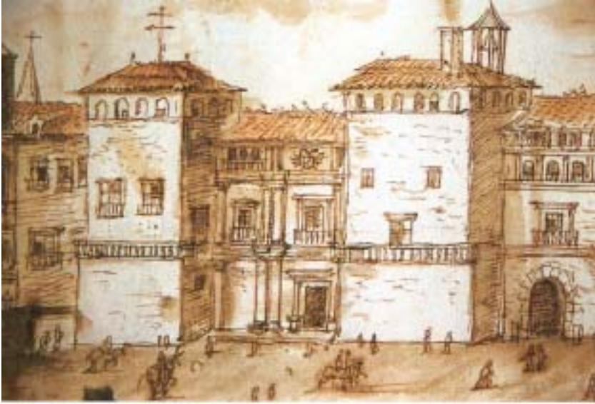
El alcázar de Madrid.

el extremo poniente de la villa. Construido en la orilla de la planicie que domina el río Manzanares, dicho alcázar, antigua fortaleza mora edificada en el siglo XIV, había sido reconstruido por Carlos V y luego remodelado y habilitado para servir de residencia a Felipe II. Una reestructuración de la fachada tuvo lugar en el reinado siguiente, aunque las obras de embellecimiento del interior se realizaron bajo Felipe IV. Sin embargo, el palacio real estaba lejos de constituir, en frase de un contemporáneo, “la fábrica real más sorprendente del mundo”.