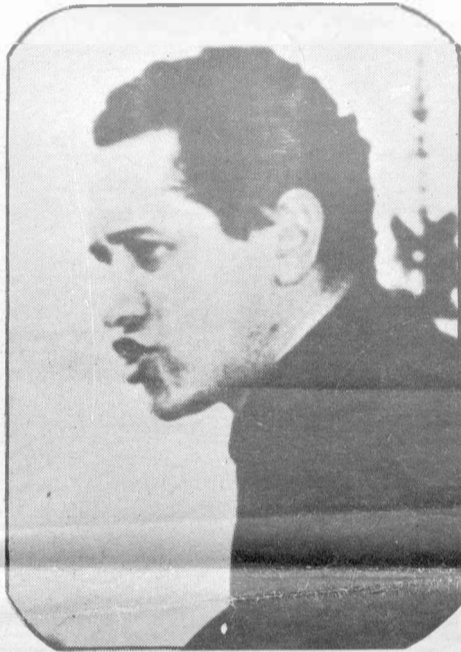
Camilo Torres... es el caso de un auténtico apóstol ligado a su pueblo.

Lo que los curas jóvenes repudian no es tanto el celibato, que en sí les parece contrario a la naturaleza, sino su mixtificación. Por eso luchan, cada vez con mayor número de adeptos, por un matrimonio que establezca su vida de hombres y vuelva más normal su sacerdocio, más pura su misión, y más auténtico su apostolado.