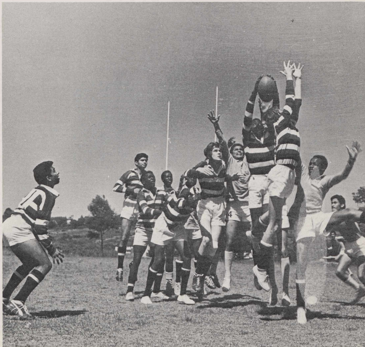
«... el Strathmore College de Nairobi (Kenia), centro interracial preuniversitario».