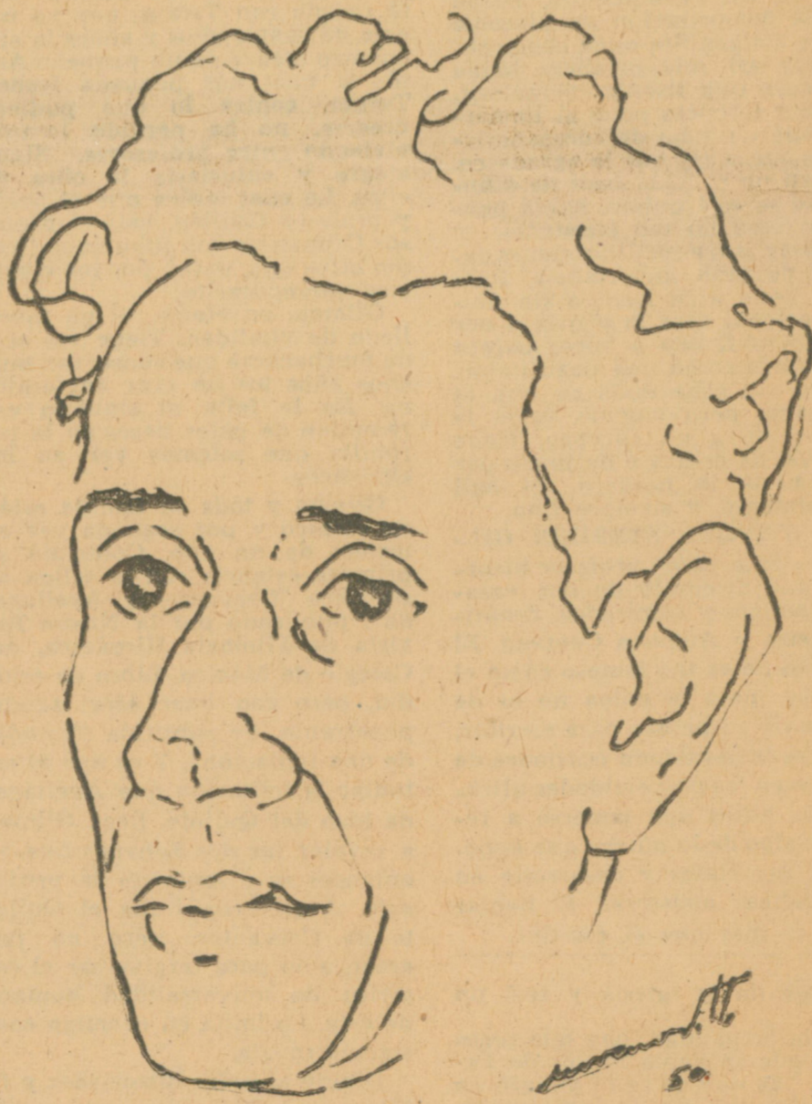
Juan José Arreola.